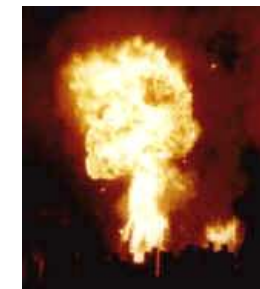
Boules de Feu