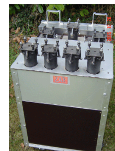
Machine à Explosion